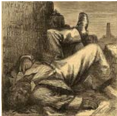
Един глас по-малко

Разделете класа на четири групи. Дайте на всяка група една от картите с въпроси, както и време да ги обсъдят. Всяка група трябва да излъчи говорител, който да запознае класа с резултата от обсъждането. Картите могат да се разпечатат в А4 формат от сайтовете на проекта.