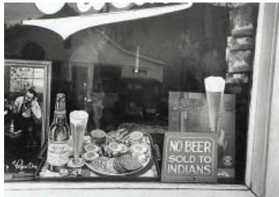
Не се сервира бира на индианци

Какво се е случило на този мъж? Как можете да го опишете? Какво значи текста "Един глас по-малко"? Какво тази карикатура се опитва да ни каже? Защо един вестник ще публикува подобна карикатура?